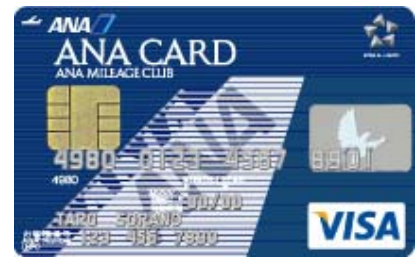
ANA VISA カード

今回の提携で、当社は「ANAカード会員の方々」を対象とした「ショッピングアルファ」*1の提携店となり、『三井のリパーク』をご利用いただいたお客様が「ANAカード」で料金を精算すると、『三井のリパーク』でのお支払い200円につき1マイルが貯まり、さらにクレジットカード会社のポイントをマイルに移行することで200円につき最大3マイルが貯まります。*2